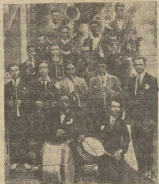
Antalya şehir bandosu

Antalya (Hususi) — Halk fırkası ve belediye reisi Hüsnü Bey memleketin ihtiyacını ve gençlikte musiki istidadının inkişafını