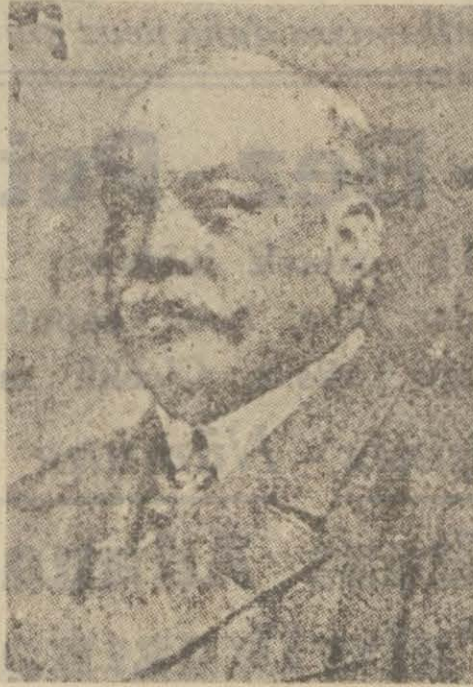
İngiltere sefiri Sir Lauter

Cemiyete mensup gazeteler, efkâr-umumiyyeyi yatıştırma için, bu üç büyük hâdiseyi mümkün olduğu kadar küçültmeye çalışıyorlar: (Devrisabıkın seyyiatı yüzünden, zaten buralar senelerce evvel manen elimizden gitmişti. Bu günkü hâdiseler, ancak madde-ten bir ilândan ibarettir.) Diye tesellikârane makaleler yazıyorlardı.. Böyle olmaklaberaber, mütecasirlerden intikam almak için, (boykotaj) a karar verilmişti. Bulgar, Avusturya, Yunan emteası alınmayacak.. Bunlar, hakka irca edilinceye kadar ticari münasebatta bulunulmayacaktır.. ilk defa Selânikli tüccarlara gelen bu ilham, Cemiyet tarafından derhal kabul ve tasvip edilmiş.. memleketin her yerinde tabikatinna girilmişti. Ellerinde külliyyetli miktarda satılmamış istok kumaşlar bulunana tüccarlar, büyük bir zekâ eseri gösterdiler. En evvel başlardaki