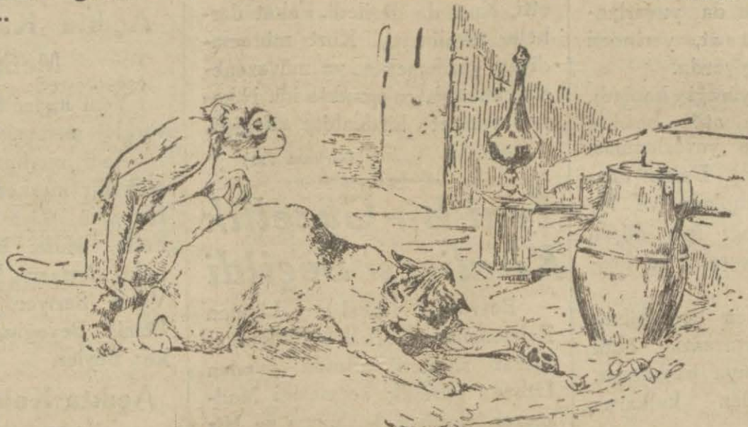
Mestana kestaneleri çıkarıyor maymun da atıştırıp duruyorlardı

Bir gün Tiptopla, Mestana mutbahta, ocağın kenarında otururlarken maymunun aklına birşey geldi.. Birkaç saat evvel, annem ocağın külleri arasına bir sürü kestane koymuştu. Ne iyil. Oh, Hele şu kestaneleri bir boğaza atsak, ne iyi olacak! diyordu.